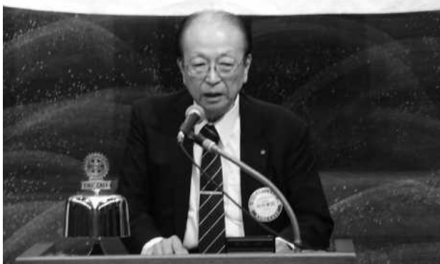
▲8月5日 臨時総会「決算・予算」