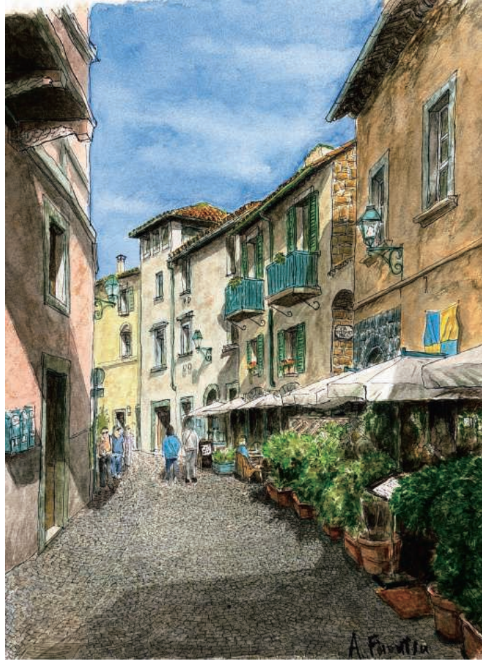
「オルヴィエートの昼下がり」